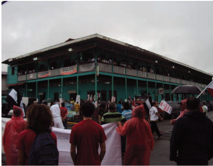
Concentración frente al Black Star Line, Limón, 4 de marzo de 2010.