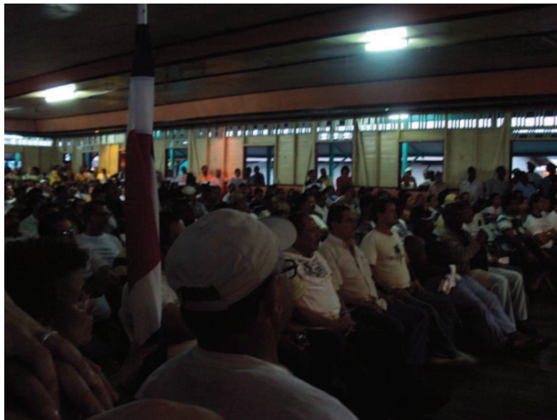
Asamblea de trabajadores de SINTRAJAP, Black Star Line, Limón, 4 de marzo de 2010.