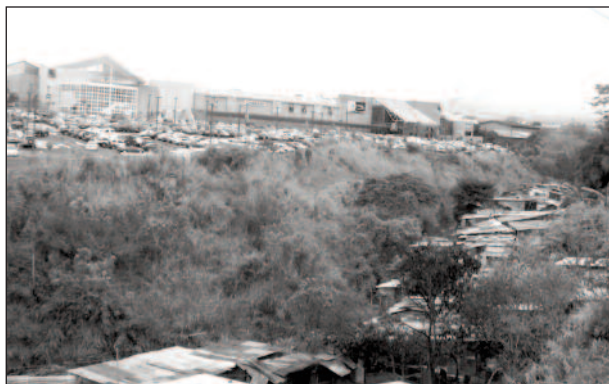
Fotografía 1 Centro comercial Multiplaza y Barrio Nuevo separados por el Río María Aguilar, Curridabat, San José

Fuente: fotografía propia (21 de setiembre de 2010).